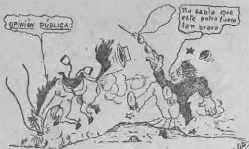
La Gran Caida

SIN COMENTARIOS (de "Fénix" de Diciembre 24, 1932).